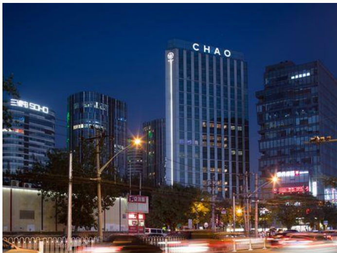
CHAO HOTEL SANLITUN

來北京三里屯CHAO 酒店體驗生活的最大可能，找到自己最舒心的生活方式，別無他法，親自來走一趟就對了！